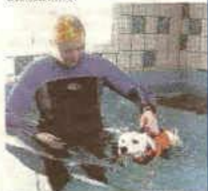
Hydrotherapie voor Nappie.

Kans' kost vijftien euro en is vanaf 24 april te bestellen via www.tweedekans.info .